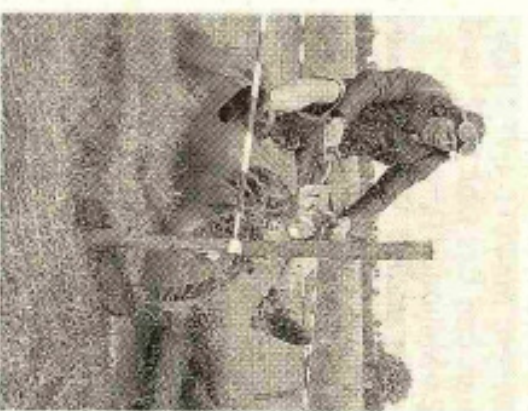
Geschicklichkeit ist gefragt.

Info SR-Treffen in Dippmannsdorf, Sonntag ab 13 Uhr, kurzfristige Anmeldungen per E-Mail unter sr-treff-dipp@freinet.de , per Fax unter (03 38 46) 4 14 19 oder per Telefon unter ☎ (03 38 46) 4 10 71.